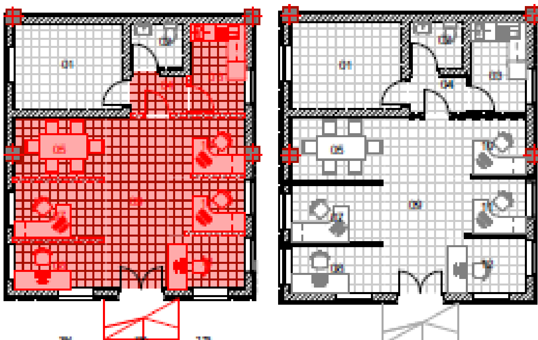
Слика 3 По реконструкцијата на проектната локација во Општина Струмица