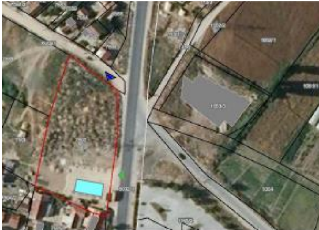
Слика 1 Микролокација на проектната област во Општина Струмица